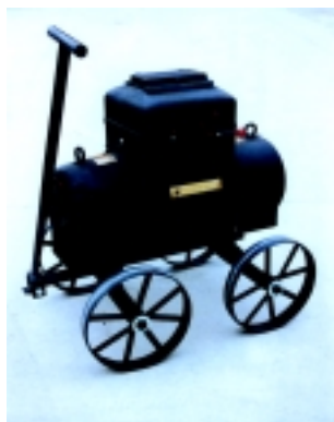
Eingehäuse-Schweißumformer Typ: KU 250, Baujahr: 1935 Hersteller: Kjellberg GmbH, Finsterwalde

Leihgabe überlassen hat. Die gemeinsam mit dem DVS-Bezirksverband Schwerin und dem DVS-Landesverband Thüringen organisierte Ausstellung ist in der neuen Galeria der Messe Essen zu sehen, deren Dach die größte Isolierglas-Photovoltaik-Anlage der Welt bildet. Das „Sonnenkraftwerk Galeria“ produziert jährlich etwa 175.000 kWh Strom aus Sonnenenergie.