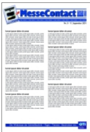
So präsentiert sich der tägliche „MesseContact“

Kurz, knapp, aktuell, informativ: Täglich erscheint während der „Schweissen & Schneiden“ der Informationsdienst „MesseContact“. Er vermittelt im Telegrammstil Neues, Nützliches, Wissenswertes rund um das Messegeschehen, wie Neuigkeiten aus der Branche, das Rahmenprogramm, interessante Gäste, außergewöhnliche Ereignisse. „MesseContact“ erscheint in deutscher und englischer Sprache.