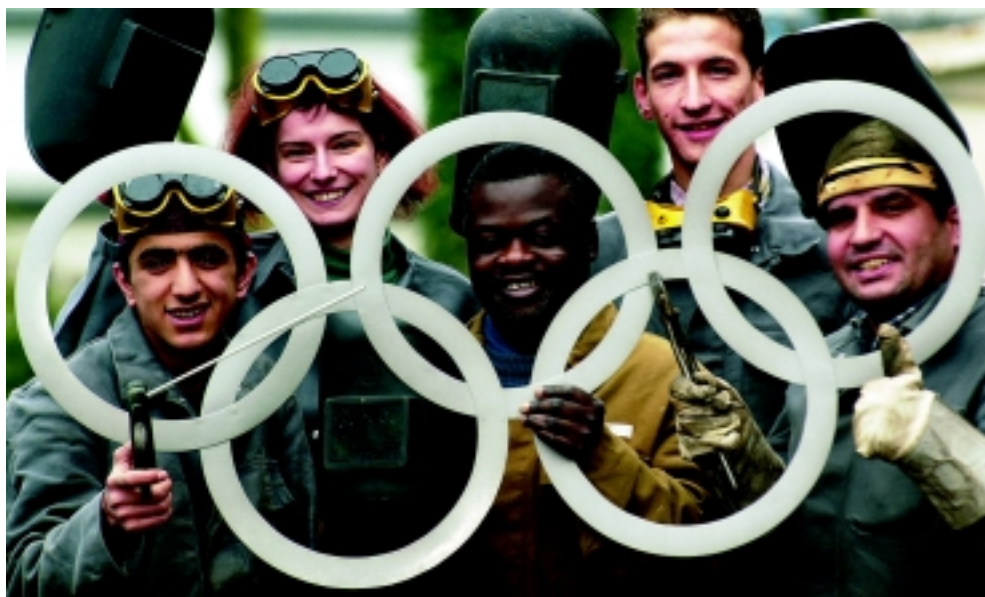
Die olympische Dimension der „Schweissen & Schneiden“ fest im Blick: Mitarbeiter und Auszubildende der Schweißtechnischen Lehr- und Versuchsanstalt Duisburg setzten das Thema praktisch um – und schweißten die olympischen Ringe.

Die „Schweissen & Schneiden“ ist auf Rekordkurs: Zirka 1.000 Aussteller werden vom 12. bis 18. September 2001 in der Messe Essen ihre Innovationen rund um das Fügen, Trennen und Beschichten vorstellen. „Wir fahren nach Essen!“